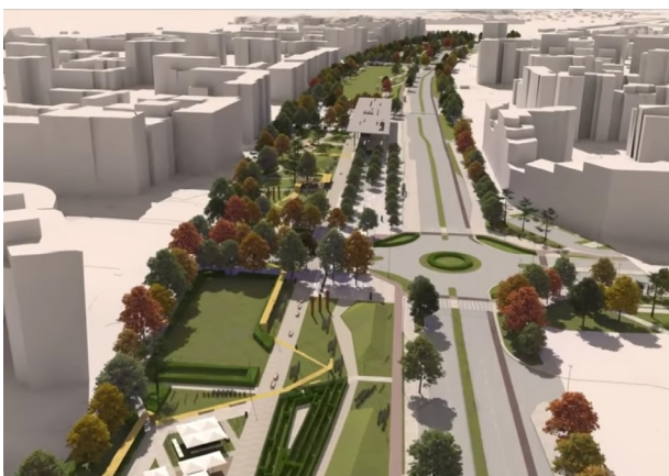
Skrzyżowanie al. KEN i ul. Płaskowickiej - wizualizacja koncepcji parku (Dzielnica Ursynów m.st. Warszawy)

Chcesz dostawać najnowsze informacje o budowie obwodnicy i planowanych utrudnieniach? Wyślij wiadomość "informacja" na kontakt@projektursynow.org .