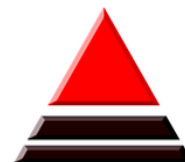
Spółdzielnia Mieszkaniowa WYŻYNY