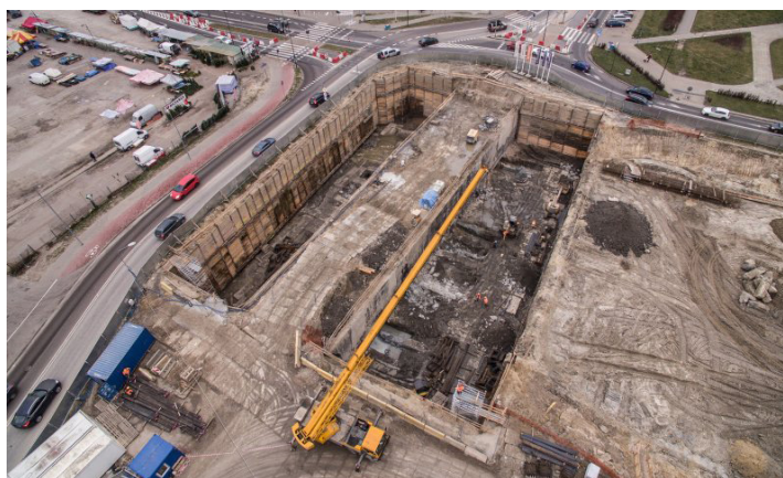
Tunel I linii metra przy skrzyżowaniu al.KEN i ul. Płaskowickiej - dotychczas jedyne miejsce robót

Pierwsze efekty decyzji Wojewody możemy obserwować już teraz. Pod topór